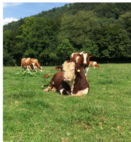
Der Stier ist meistens dabei auf der Weide