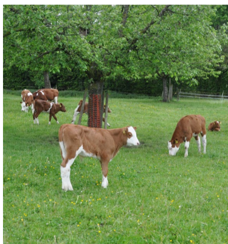
Die Kälber gehen im Sommer täglich auf die Weide