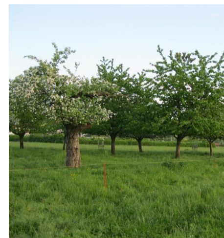
Obstbäume auf artenreichen Wiesen: Auch Naturschutzprojekte gehören zum Betriebskonzept