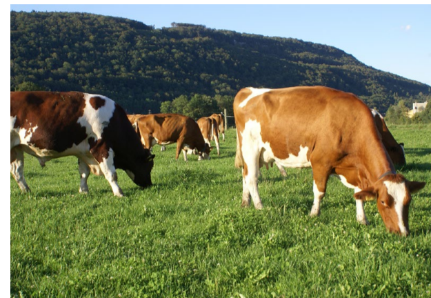
Die 11-jährige Saskia ist eine typische Lebensleistungskuh: in der 1. Laktation gab sie nur 4300 kg, in den folgenden 5 Laktationen aber über 6000 kg Milch. Neben ihr ist der Stier Sandro